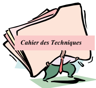
Figure 1 : légende figure, centré, police Times New roman 12, italique

1.5.c figures, tableaux : Essayer de réduire les figures et les photos ou de les regrouper sur une même page ; porter sous les figures, tableaux,... la légende correspondante.