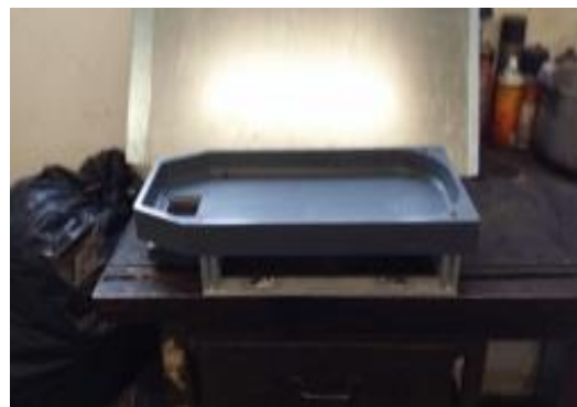
Figure 9. Auge sans coin.