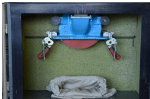
Figure 6. Système d'attache du porte sac de type sauterelle.

Sur la partie inférieure du broyeur à marteaux ( Figure 6 ), les attaches à ressort du porte sac sont remplacées par des attaches de type sauterelle beaucoup plus faciles à manipuler. L'ouverture du caisson se fait par une double porte équipée de deux contacteurs qui coupe l'alimentation du moteur du broyeur en cas d'ouverture.