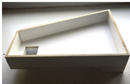
Auge en PVC fixe ouverte