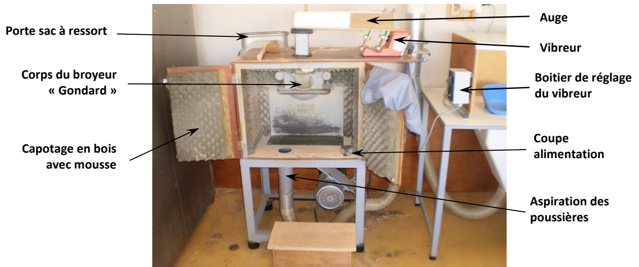
Figure 3. Description du broyeur « Gondard » après les adaptations réalisées en 1996..

Afin de diminuer la gêne occasionnée par les émissions de poussières, nous avons commencé par installer un système d'aspiration afin de capter les poussières émises lors du broyage et de la manipulation de la poudre. Des postes de travail avec aspiration intégrée ont été créés à côté de chaque broyeur pour manipuler la poudre en limitant la dispersion des poussières dans la salle. En effet, après broyage, plusieurs manipulations sont nécessaires. La poudre contenue dans le sac de broyage est déversée dans une bassine pour être homogénéisée puis dans un tube plastique de 150 mL pour son stockage. Ce système d'aspiration était animé par moto-ventilateur et la séparation de l'air et de la poudre se faisait par un filtre à manches avec la récupération des poussières dans 12 sacs en plastique situés en dessous. Avant l'installation de cette aspiration, aucun système d'extraction et de récupération des poussières n'existait dans cette salle.