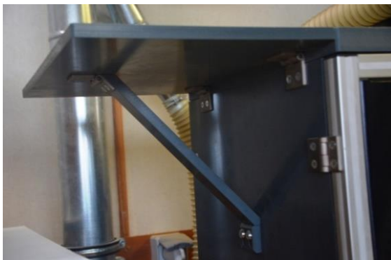
Figure 8. Tablette escamotable.

Ces modifications ont été réalisées par une entreprise locale sur propositions des utilisateurs et du responsable de la salle de broyage.