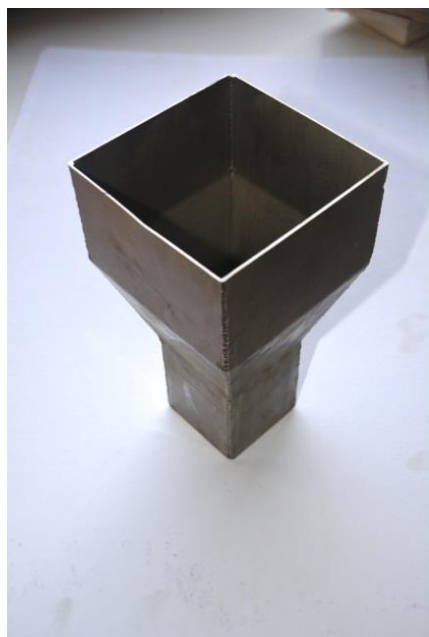
Auge en inox