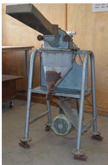
Figure 1. Broyeur à marteaux « Gondard » datant de années 50 à l'origine du projet.

Après chaque broyage le porte grille est nettoyé à l'aide d'une brosse, le sac est retourné et la poudre restante est aspirée sur une bouche d'aspiration grillagée. Enfin la cuvette est nettoyée à l'air comprimé.