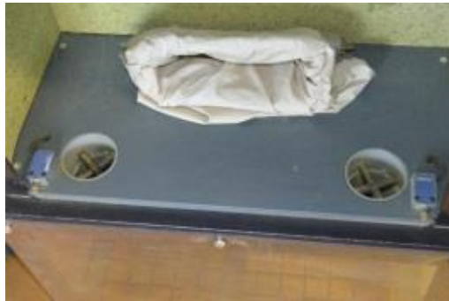
Figure 7. Bouches d'aspiration dans caisson du broyeur. (Photo S. Blugeon, URP3F, Inra).

croisillons sont fixés dans les bouches et limitent tout risque d'aspiration du sac de broyage par le système d'aspiration