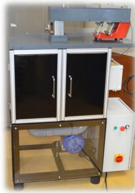
Figure 5. Vue d'ensemble du nouveau broyeur avec modifications réalisées par une entreprise spécialisée.

Le broyeur est placé en partie haute dans un caisson en acier qui est habillé à l'extérieur avec du PVC et à l'intérieur avec de la mousse spécialement conçue pour limiter le bruit ( Figure 5 ). Ce caisson vient remplacer l'ancien caisson en bois.