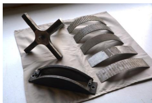
Figure 2. Organes de broyage du broyeur « Gondard » (marteau, porte-grille et grilles de 0,5 à 2 mm).