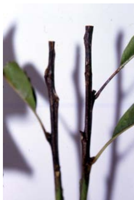
Photo 1 : Test sur tiges excisées : exemple de nécrose développée sur un hybride ( C. sativa x C. crenata ) relativement sensible, 10 jours après inoculation.

La lecture se fait 10 jours après l'inoculation. Les capuchons d'aluminium, sont ôtés et on mesure la longueur de la nécrose due au pathogène depuis le point d'inoculation (Photo 1). La notation est effectuée en mm avec un pied à coulisse. Pour chaque tige, on note le génotype, les blocs et les répétitions.